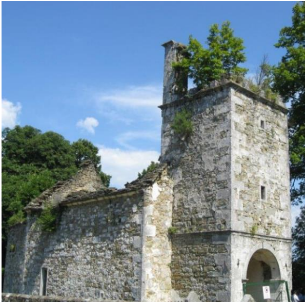
Chiesa San Tommaso (Sv. Tomaž)