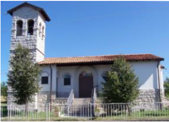
Chiesetta di Pesek