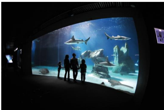
Acquario di Genova

Art. 4 Ai partecipanti si chiede correttezza nel contegno e soprattutto di attenersi alle disposizioni del Direttore di Escursione e, quando richiesto, di collaborare con lui per facilitare il buon esito dell'escursione.