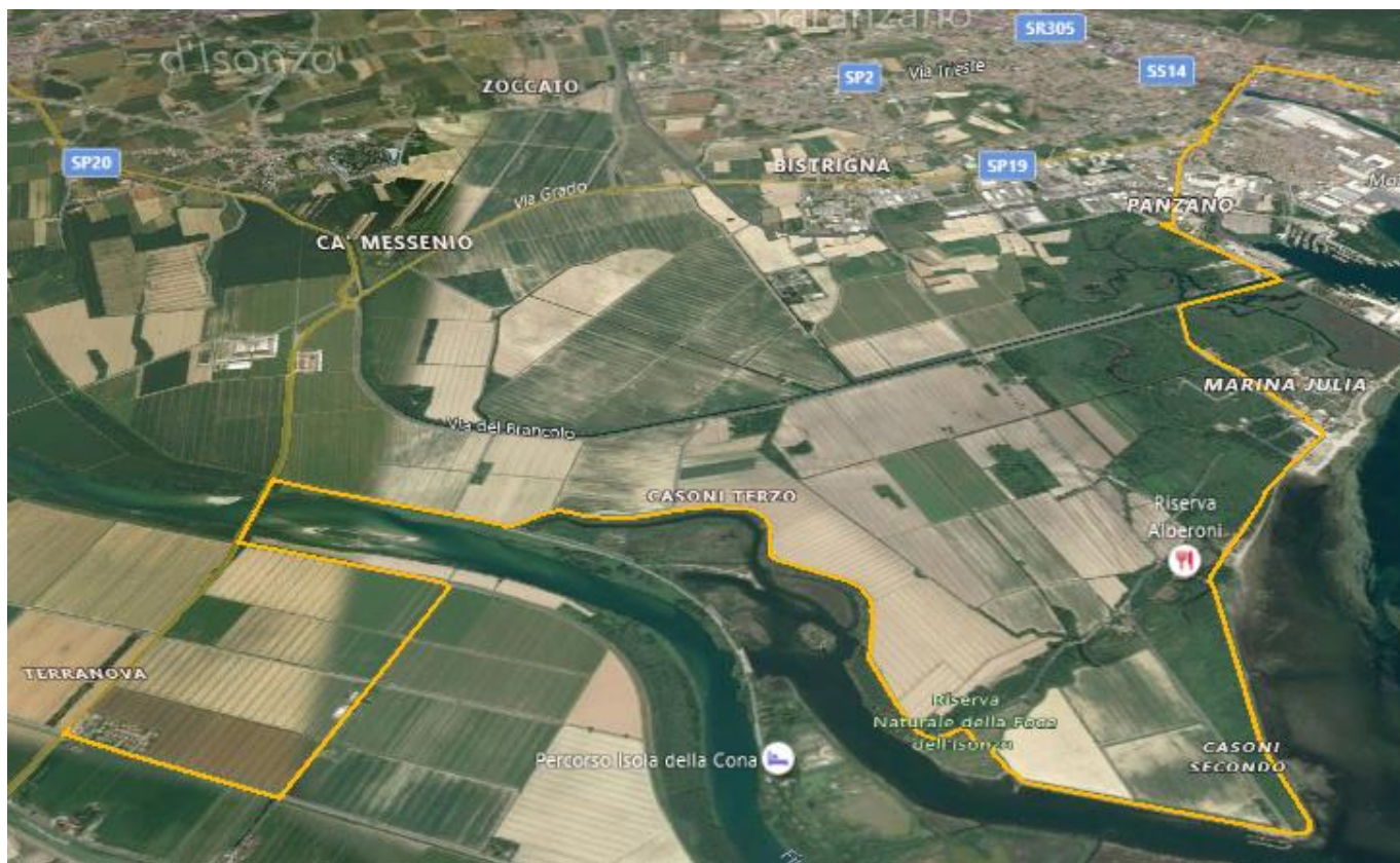
Riserva naturale della Foce dell'Isonzo